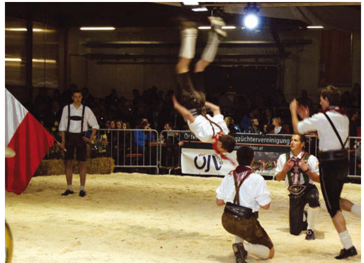
Spektakuläre Darbietungen der Plattergruppe der LLA Lienz

Am vorletzten Wochenende im März fand in Imst der Schauhöhepunkt für die österreichischen Jungzüchter statt. Beim Fachschulen-Kreativwettbewerb stellten 9 Fachschulen aus ganz Österreich ihre Schulen vor. Ob Kalbinnenreiten oder Schuhplatteln auf den Kalbinnen, der Kreativität waren keine Grenzen gesetzt. An die Spitze setzte sich die LFS Hohenlehen (NÖ), die auch schon einen Wettbewerb in Niederösterreich gewonnen hatte, knapp gefolgt von der FS Otterbach (OÖ) und der LLA Weitau (T). Die LLA Lienz belegte den 5. Rang. Schon am Sonntagmorgen begann der Wettkampf um den Titel „Österreichs bester Vorführer“. 245 Jungzüchter trainierten wochenlang, um die Tiere perfekt vorzubereiten. An den Vorführleistungen konnte man die Liebe der Jungzüchter zu der Arbeit mit den Tieren sehen. Das immer höher werdende Niveau zeigt, dass die Jungzüchter sich ständig weiterbilden und auch Weiterbildungsangebote ständig nutzen. Die ÖJV gratuliert allen Jungzüchtern zu den hervorragenden Leistungen.