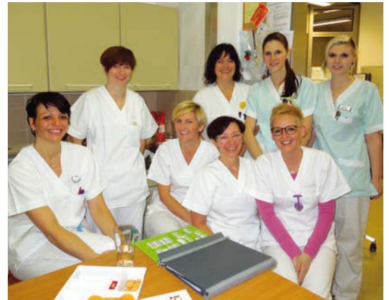
Das Pflgeteam der Station Erdgeschoß SÜD