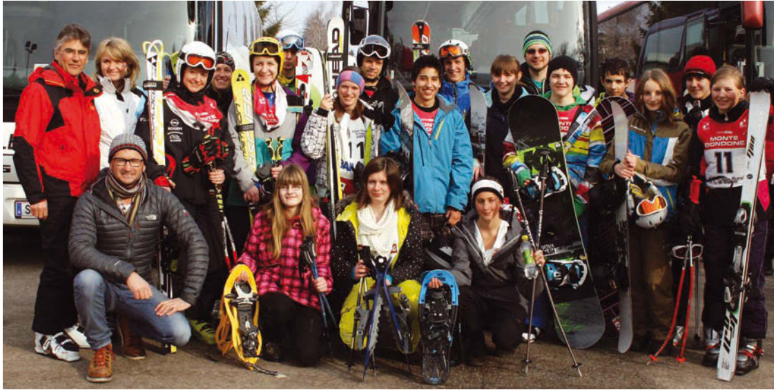
Das erfolgreiche Team der LLA Lienz beim Gesamttiroler Wintersporttag im Trentino