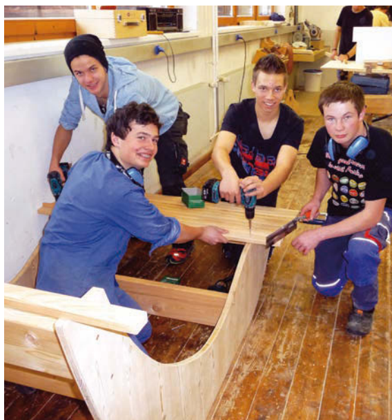
Viele Gründe für eine kreative Relax-Liege... Erinnerung an die LLA, ein Unikat zum Chillen, ein sinnvolles Werkstück, gefragtes Möbelstück für den Garten