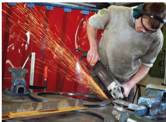
Arbeit in der Metallwerkstätte

Frischkäse, Weichkäse, Jogurt, Hüttenkäse, Schnittkäse, Butter, Ziegenkäseballchen... dies sind nur einige Produkte, die in der Spezial Praxiswoche vom 17. bis 20. Februar 2014 im Bereich Milchverarbeitung hergestellt wurden. „Milch ist ein sehr vielseitiges Medium. Dies erkannten wir wieder einmal mehr in dieser Woche!“