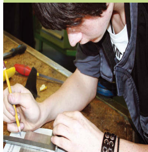
Vielältiges Arbeiten in Theorie und Praxis ge-währleistet eine profunde Vorbereitung auf spä-tere Berufe