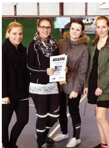
Team FSH LLA Lienz, 9. Platz